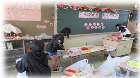
体育館や教室を、きれいに飾りました！