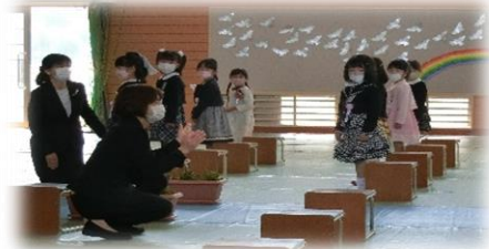
立派な態度でしたね！